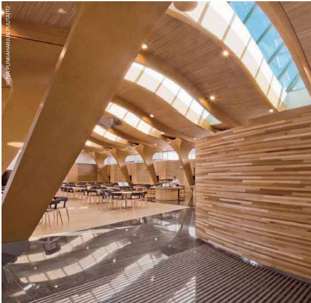
Punkaharjun puutaito toteutti puurakenteet Metsätapiola-rakennukseen Espooseen

Palkankorotusten lisäksi työehtosopimukseen tehtiin muutamia tekstimuutoksia muun muassa vanhempainvapaaseen, työtuntijärjestelmän muuttamiseen, luottamusmiehen valintaan, keskituntiansion määritelmään ja arkipyhiiin liittyen.