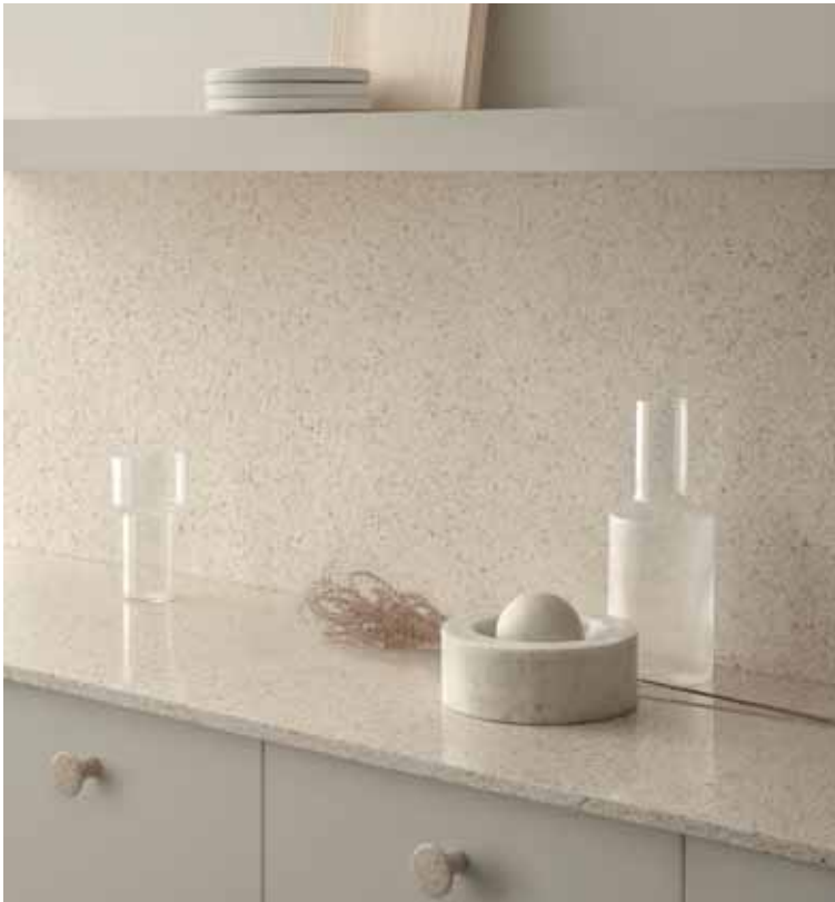
Woodion puu-komposiitista valmistetaan myös seinä- ja tasopaneeleja.