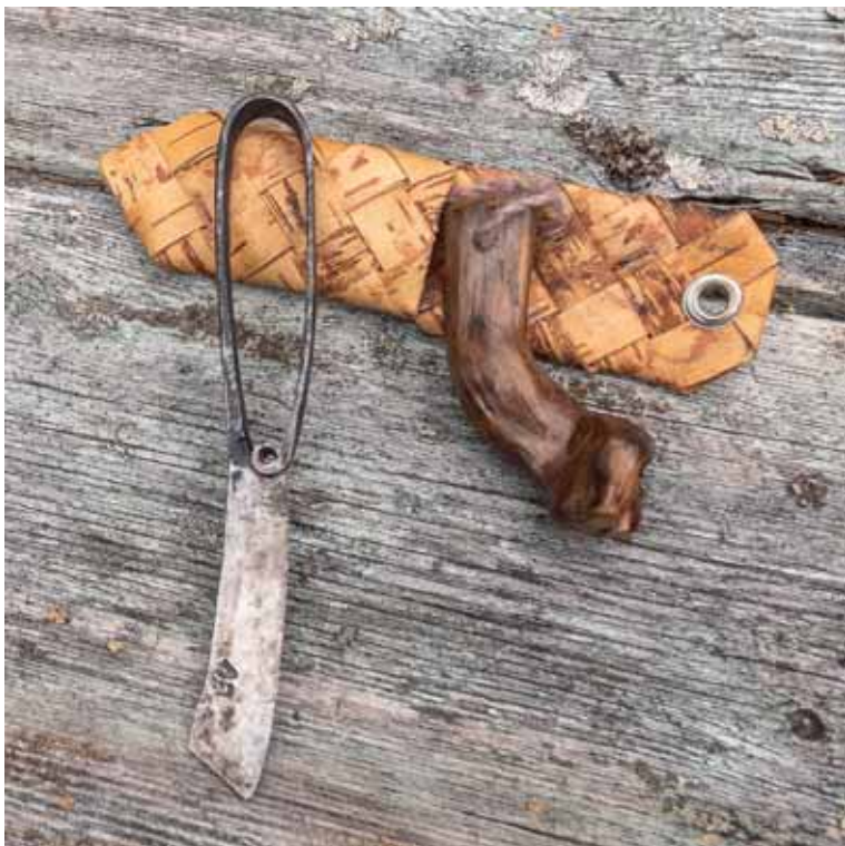
Metsäreissuilla Nylanderilla on aina mukanaan keskipohjalainen emännänpuukko, sekä liekopuun palanen, joka on noussut turvetuotannon myötä suosta, nykyisestä Leivonmäen kansallispuistosta.

Paljain jaloin käveleminen tasapainottaa ja pienentää kiireen ja stressin aiheuttamaa ihon lisääntynyttä sähköjohtavuutta, kehomme omaa biosähköä. Jos kävely tuntuu hankalalta, voi istuutua kannolle, riisua sukat ja kenkät pois, tassutella paikallaan ja tuntea maata. Paljasjalkakävely pitää yllä tasapainoa ja luonnollista kävelytuntumaa. ■