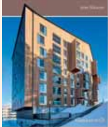
Puurakentaminen Siikanen, Unto Rakennustieto, 2016