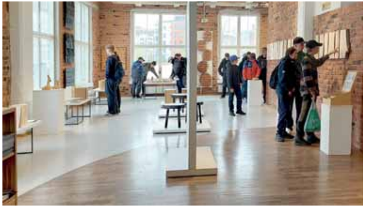
KUVAT PRO PUU RY