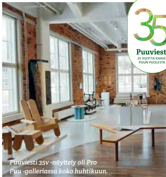
Puuviesti 35v -näyttely oli Pro Puu -galleriassa koko huhtikuun.