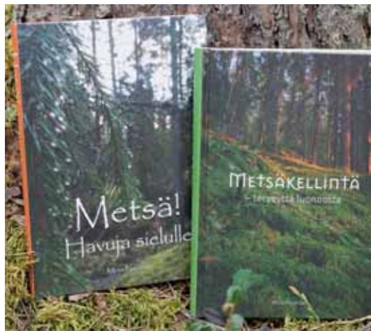
Metsäkellintä – terveystä luonnosta avaa metsäsuomalaista viisausperintöä hyvinvoinnin ylläpidossa nykypäivään tuotuna. Metsä! Havuja sielulle on kirja metsästä, alkuvoimaisesta metsäviisaudesta.